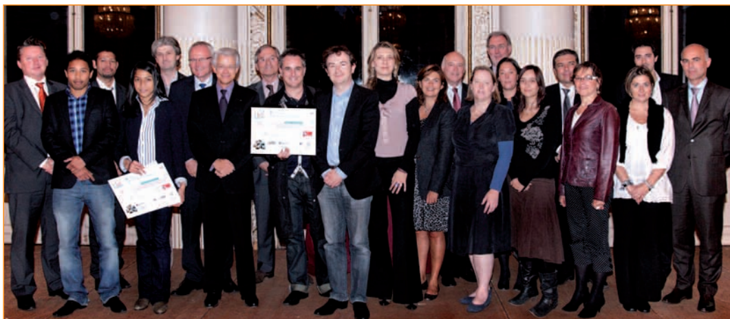
Les lauréats Cré'ACC 2010, en compagnie des partenaires et organisateurs, à la CCIP, le 11 octobre dernier